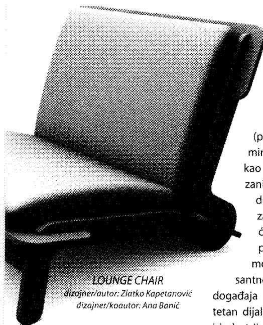
LOUNGE CHAIR dizajner/autor: Zlatko Kapetanović dizajner/koautor: Ana Bonić

poslužio je kao odskočna daska za buduću suradnju između proizvođača i dizajnera (projekt bi trebao trajati minimalno pet godina), i kao takav je uspio. Bit će zanimljivo vidjeti da li će država sljedeće godine zaista dodijeliti obećani budžet za ovaj projekt kako bi se on mogao nastaviti. Interesantno će biti pratiti razvoj događaja ako se ostvari kvalitetan dijalog između dizajnera i industrije. Okrugli stol održan